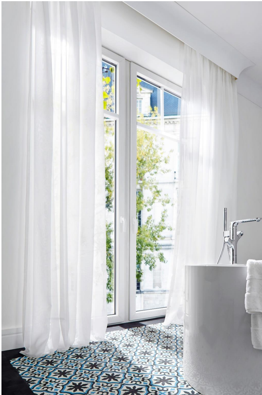
Hygienefördernder Sichtschutz: drapilux 769 mit der intelligenten Zusatzfunktion drapilux antimicrobial