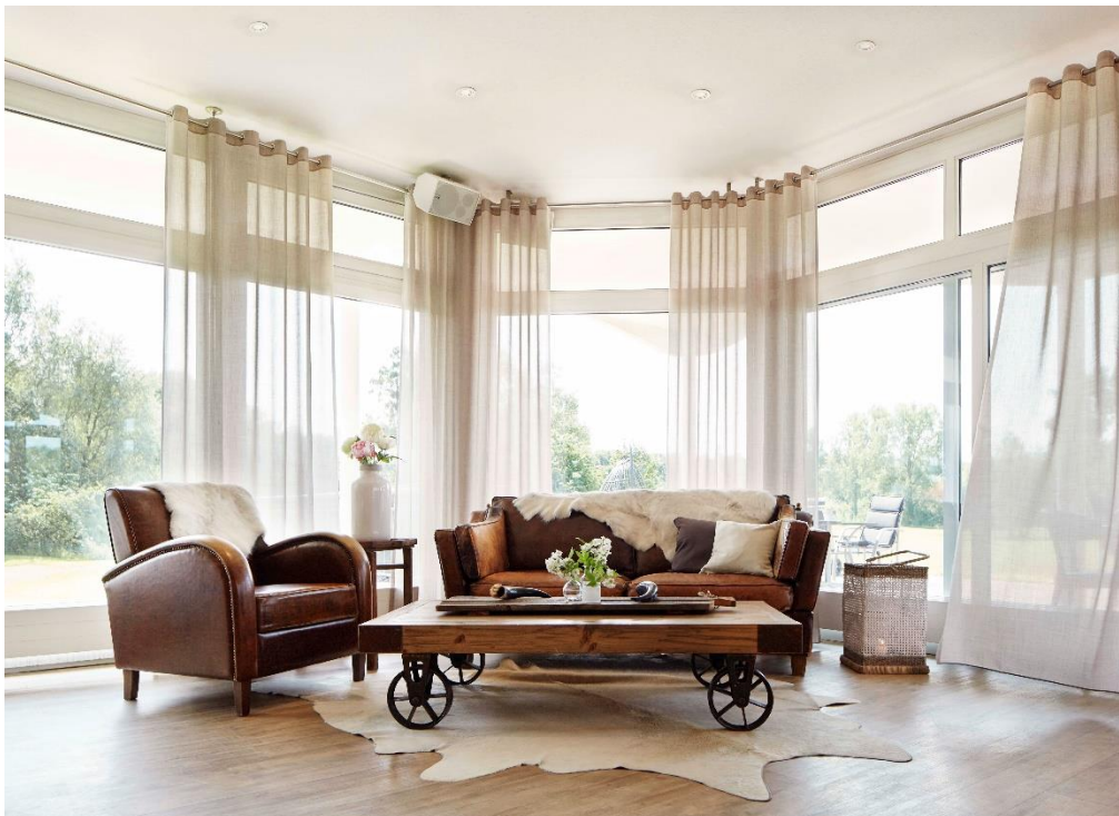
Der semitransparente Faux-Uni drapilux 795 verleiht dem Raum Leichtigkeit und trägt dank drapilux antimicrobial zur Hygienekette bei