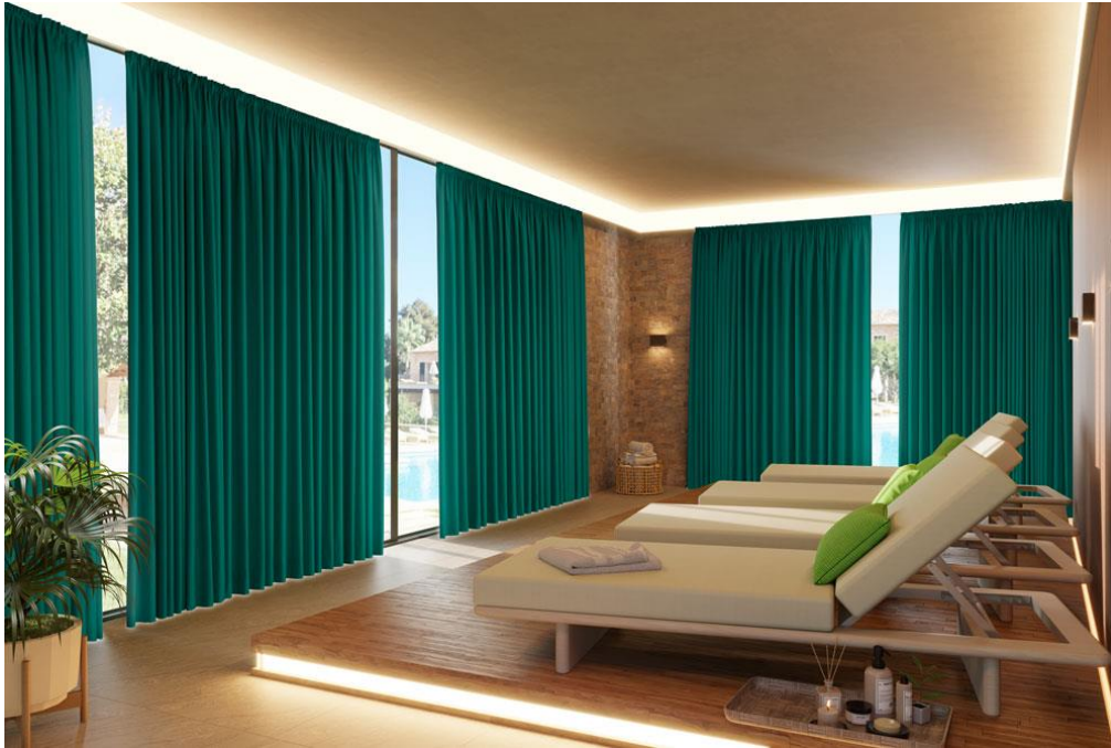
Der beliebte Allrounder drapilux 117 – jetzt auch mit drapilux antimikrobiell. Der Uni ist vielseitig kombinierbar © drapilux