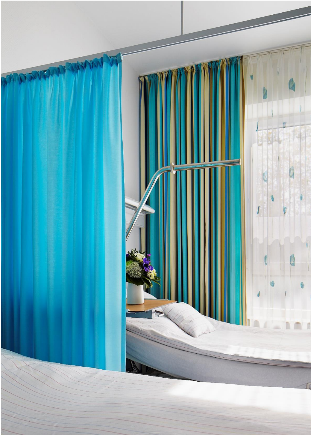
Freundliche Streifen: drapilux 191 hellt jedes Zimmer im Krankenhaus auf. Dank drapilux antimicrobial trägt der Stoff zudem zur Hygienekette bei